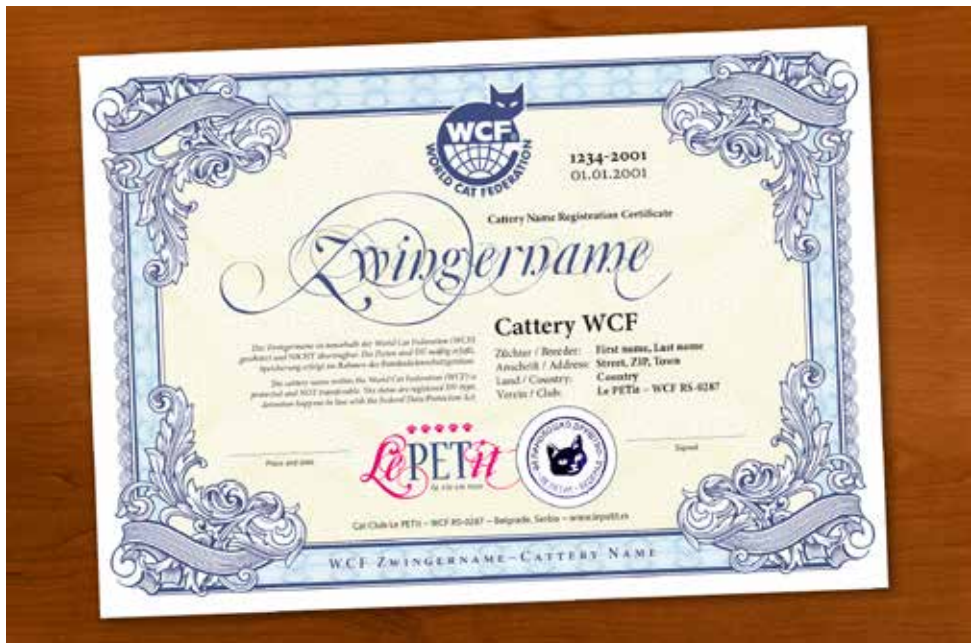
WCF sertifikat odgajivačnice. Sve WCF odgajivačnice

Na ilustracijama su primeri sertifikata o međunarodnoj registraciji odgajivačnice. Prilikom kontakta sa odgajivačem zatražite uvid u sertifikat. Te podatke zatim možete proveriti na sajtu organizacije: