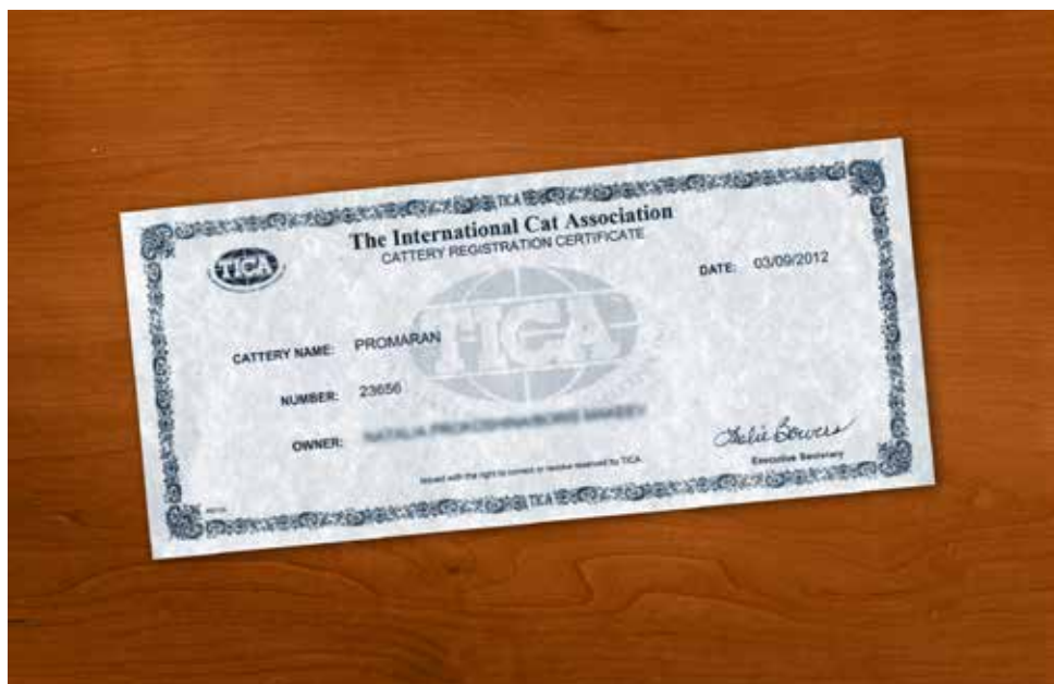
TICA sertifikat odgajivačnice. Sve TICA odgajivačnice