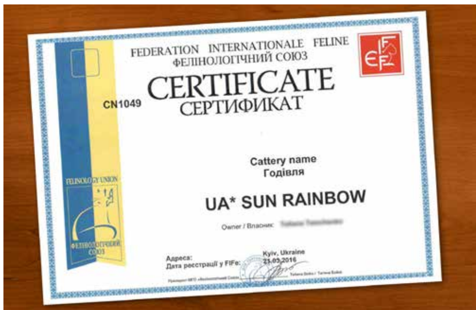
FIFe sertifikat odgajivačnice. Sve FIFe odgajivačnice